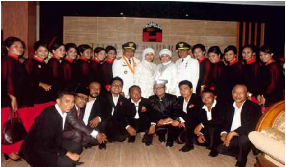
PADUAN SUARA GEMA AKSI WEDA Weda, Indonesia