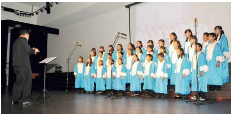
PADUAN SUARA ANAK BATAM Batam, Indonesia