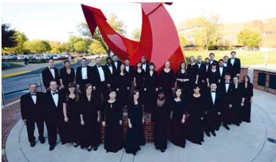
UNIVERSITY OF LOUISVILLE CARDINAL SINGERS Louisville, KY, USA