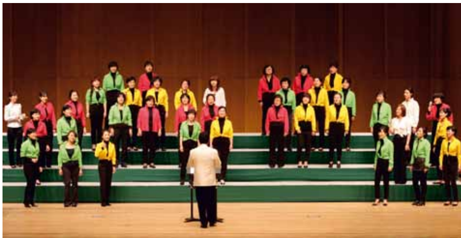
ULSAN NAMGU LADIES CHOIR Ulsan, Republic of Korea