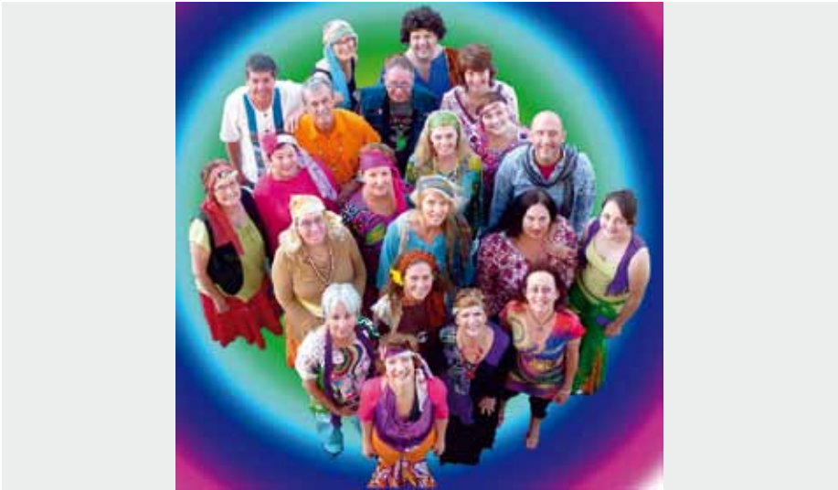
VOICE WEAVERS Tweed Heads - Coolangatta, Australia