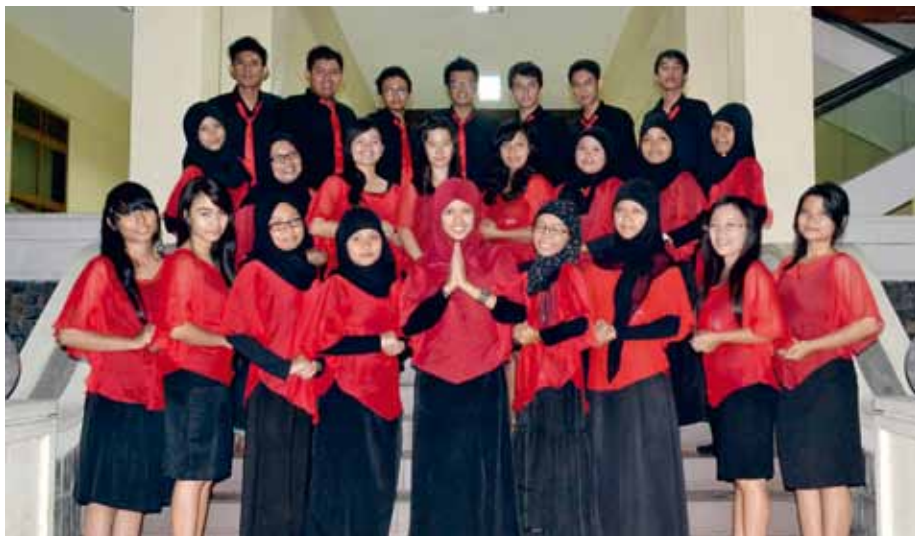
NARAWUNGGI DASANDRIYA UTY CHOIR Yogyakarta, Indonesia