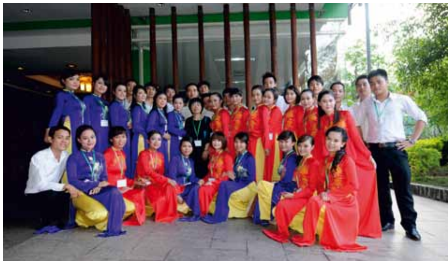
HUE ACADEMY OF MUSIC Thành phố Huế, Vietnam