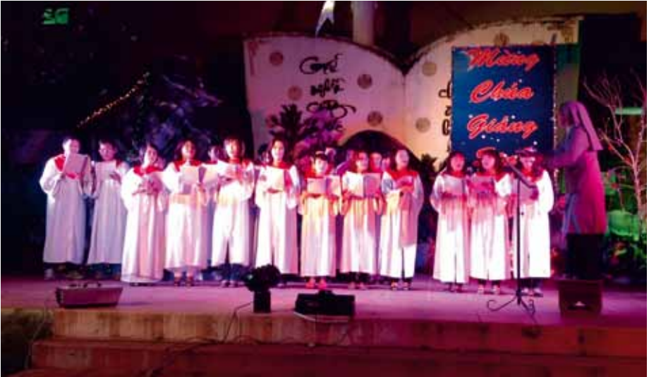
HỘI AN HOLY SPIRIT CHOIR Hội An, Vietnam FESTIVAL