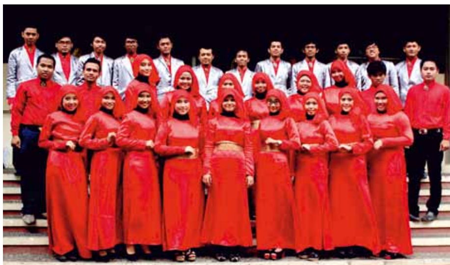
UIN SYARIF HIDAYATULLAH CHOIR Jakarta, Indonesia