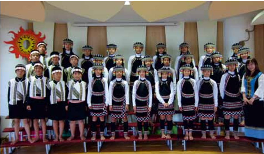
PANAN CHOIR Taipei, Chinese Taipei