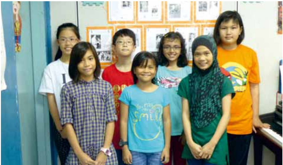
SWEET 13 Shah Alam, Malaysia