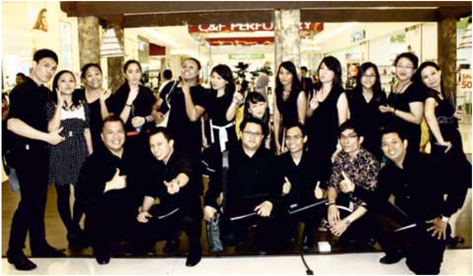
VOICE OF SOUL Jakarta Selatan, Indonesia