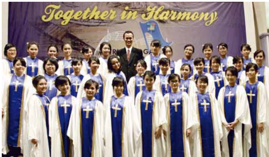
TRI TUNGGAL CHRISTIAN SCHOOL CHOIR Semarang, Indonesia