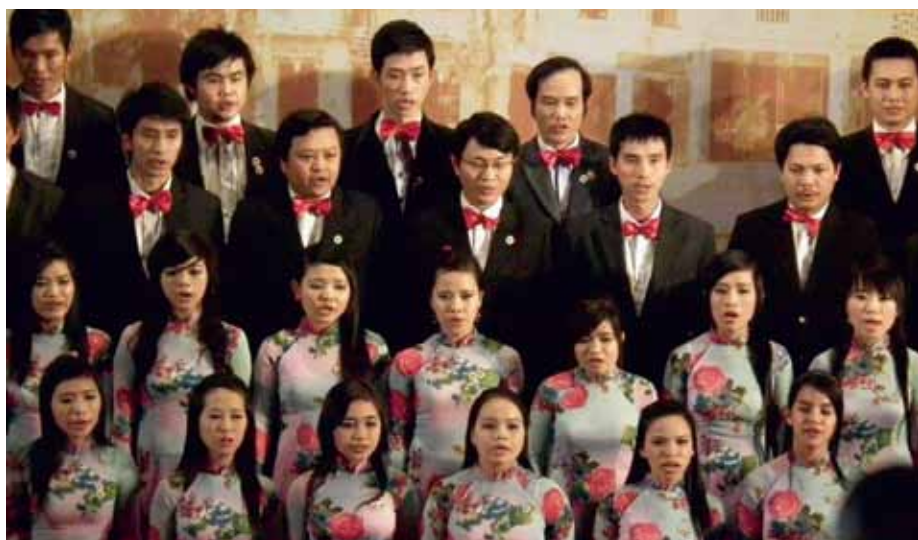
QUANG NAM CENTER FOR CULTURE Hội An, Vietnam