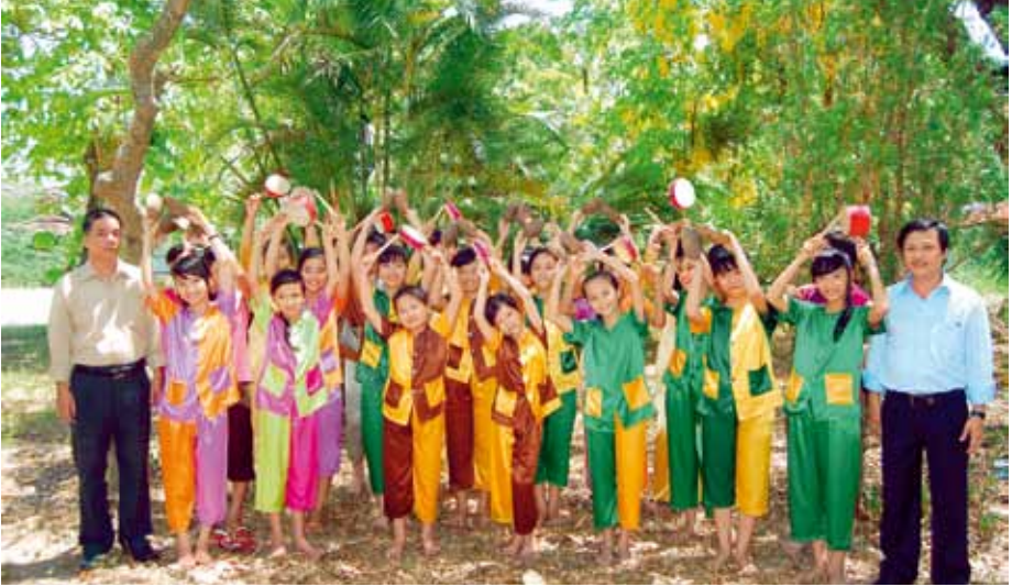
HỘI AN CHILDREN'S CHOIR CLUB Hội An, Vietnam F