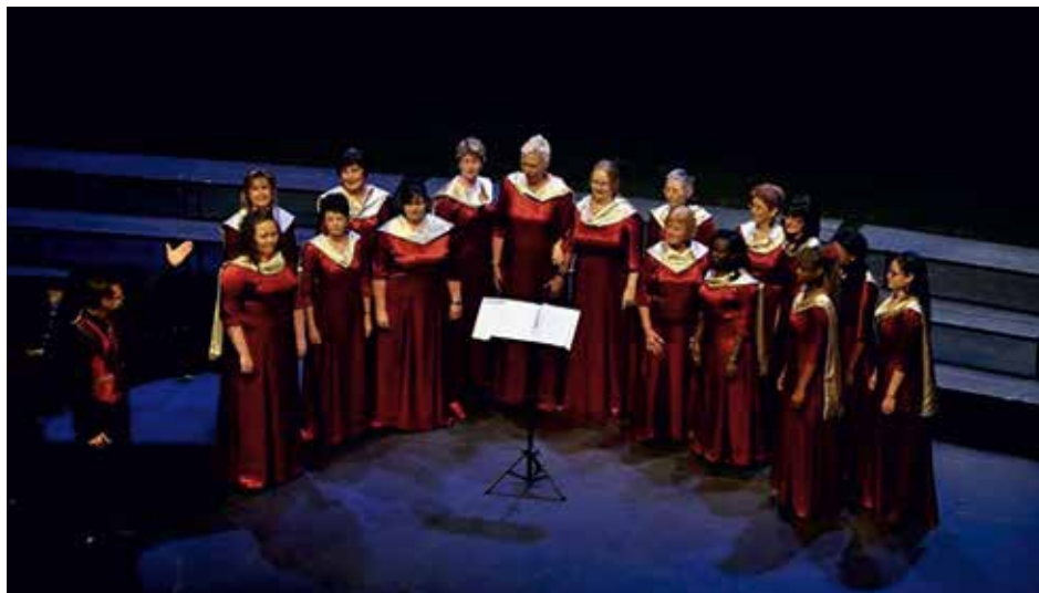
FEMME VOCALE NAMIBIA Windhoek, Namibia