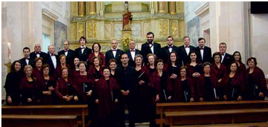
CORAL VILA FORTE Porto de Mós, Portugal