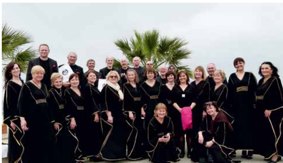
CHOR KAMERALNY TOWARZYSTWA H. WIENIAWSKIEGO, POZNAN Poznań, Polonia / Poland