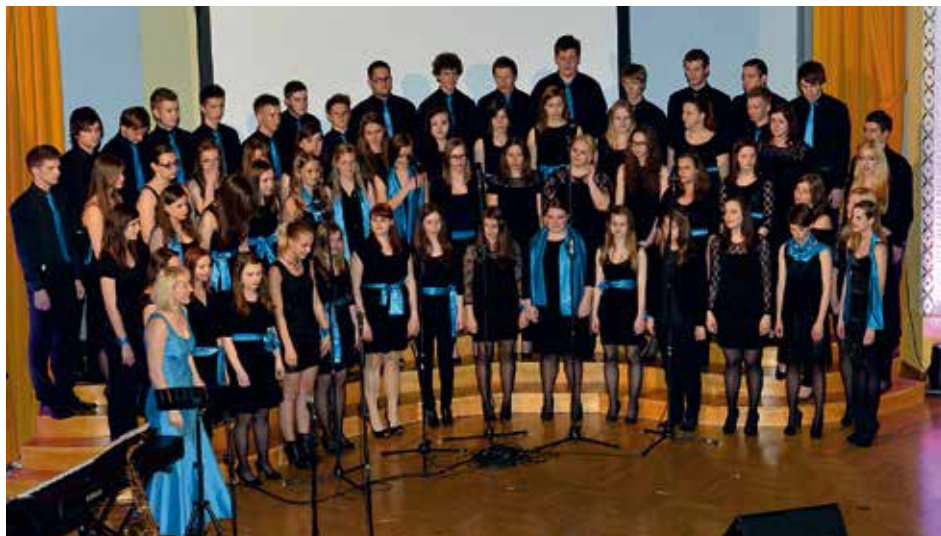
MEŠANI MLADINSKI PEVSKI ZBOR ŠOLSKEGA CENTRA CELJE Celje, Eslovenia / Slovenia