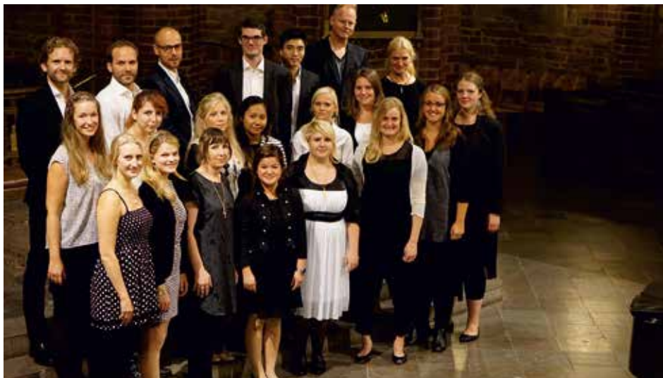
HELINGSBORGES MOTETTKÖR Helsingborg, Suecia / Sweden