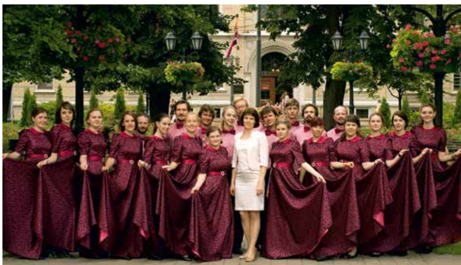
COLLEGIATE A CAPPELLA CHOIR OF MSLU "MUSICA LINGVAE" Moscow, Russia / Russia

Director / Conductor: Flávio Ulisses Cardoso