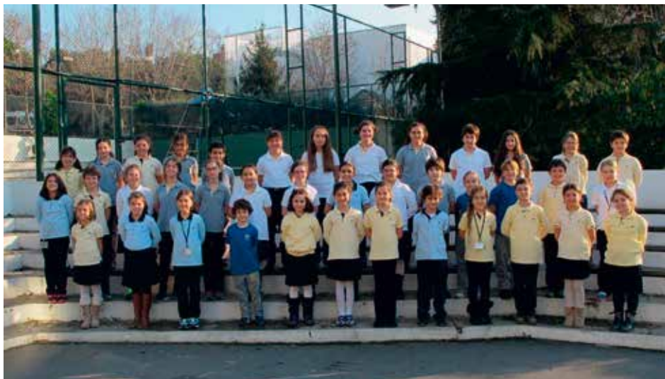
ISTANBUL FMV AYAZAĞA İSİK SCHOOLS CHOIR Istanbul, Turquia / Turkey