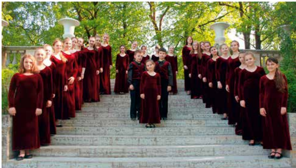
CHILDREN'S CHOIR ISTOK St. Petersburg, Rusia / Russia