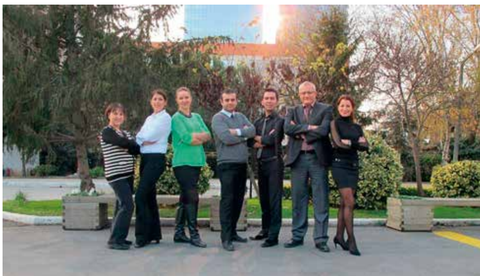
FMV AYAZAGA İSİK SCHOOL TEACHERS VOCAL GROUP Istanbul, Turquia / Turkey