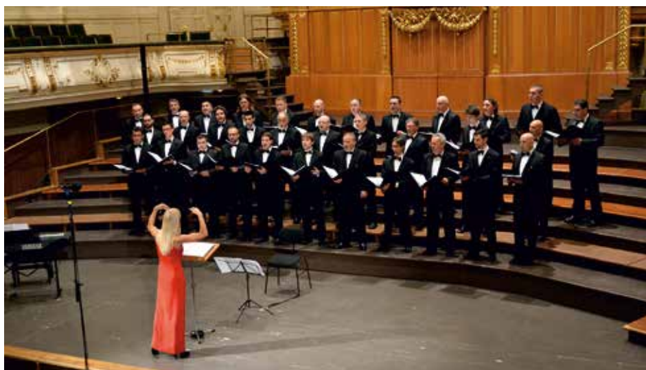
CORO POLIFONICO DI RUDA Ruda, Italia / Italy