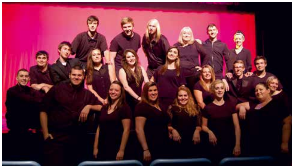
ROANE STATE COMMUNITY COLLEGE CONCERT CHOIR Harriman, Tennessee, Estados Unidos de América / United States of America F