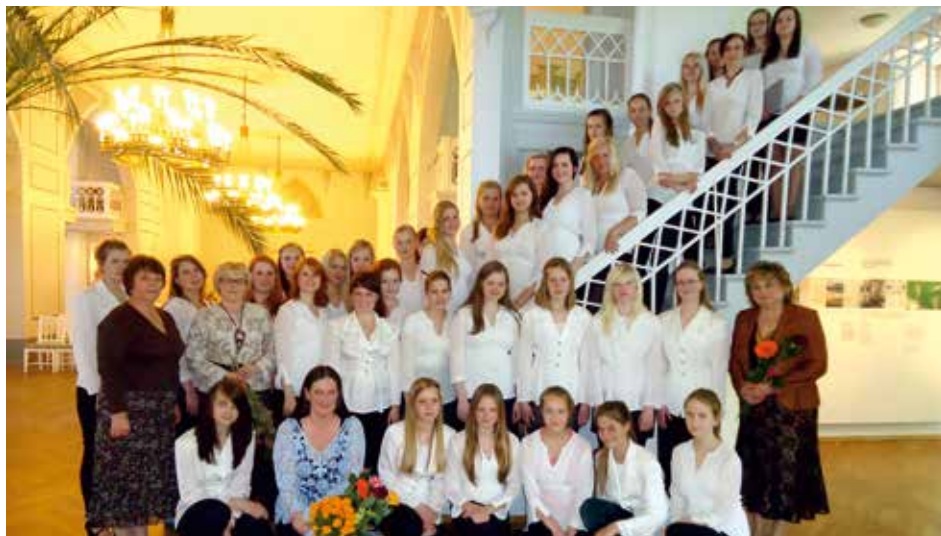
NEIDUDEKOOR KUREKELL Tartu, Estonia