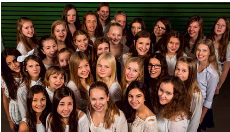
BRUNNSBO MUSIKKLASSERS FLICKKÖR Göteborg, Suecia / Sweden