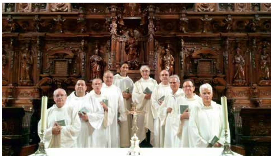
VOCES CAPITULI Málaga, España / Spain