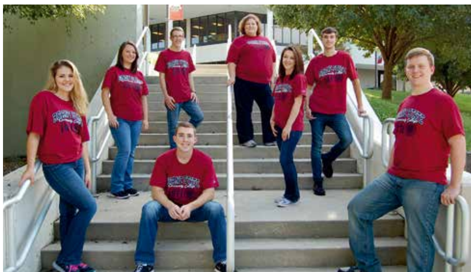
ROANE STATE COMMUNITY COLLEGE CELEBRATION SINGERS Harriman, Tennessee, Estados Unidos de América / United States of America C2