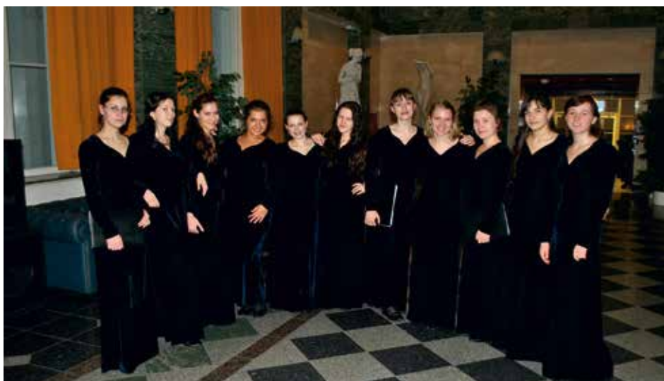
VOCAL-CHORAL ENSEMBLE "ISTOK" St. Petersburg, Rusia / Russia