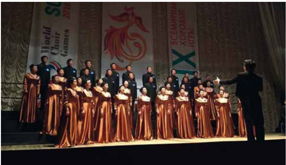
SHENYANG FENG ZHI YUN CHOIR Liaoning, Shenyang, Κίνα / China