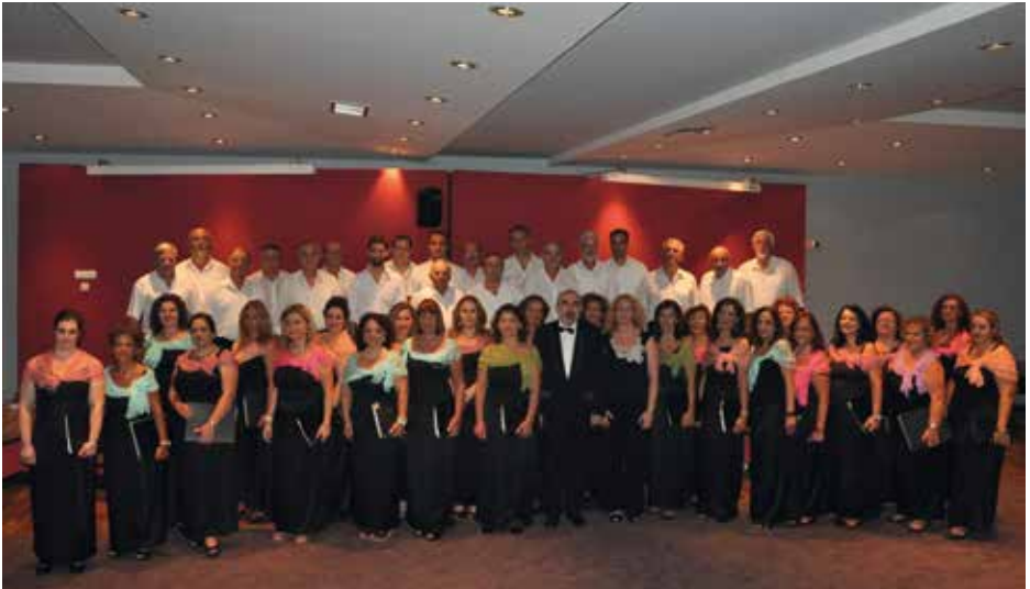
CORFU MUNICIPAL CHOIR SAN GIACOMO Corfu, Ελλάδα / Greece