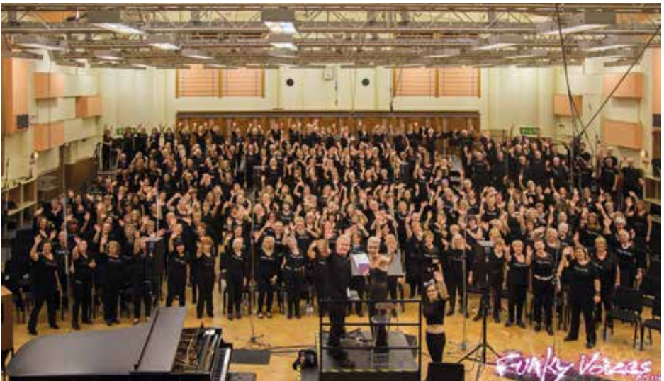
FUNKY VOICES Colchester, Μεγάλη Βρετανία / Great Britain