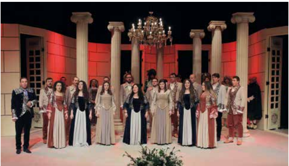
APPASSIONATO CHOIR Targoviste, Ρουμανία / Romania