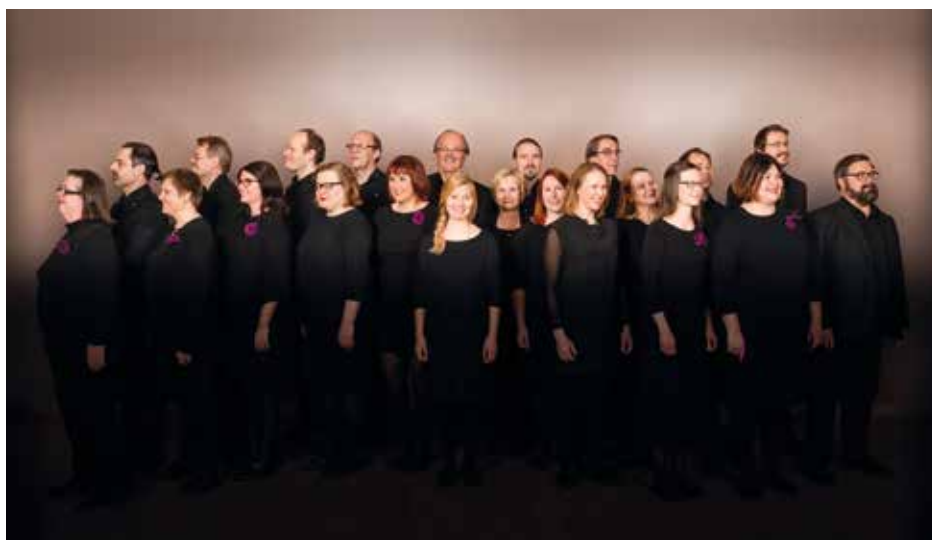
KAMARIKUORO SONORENSEMBLE Helsinki, Φινλανδία / Finland