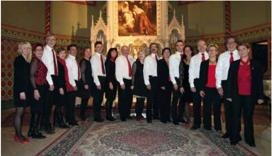
SUNNMØRE FESTIVAL KOR Ørskog, Νορβηγία / Norway