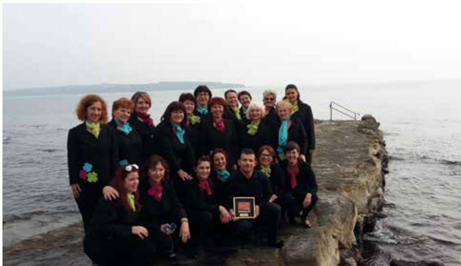
KUD "UČKA" MATULJI Matulji, Κροατία / Croatia