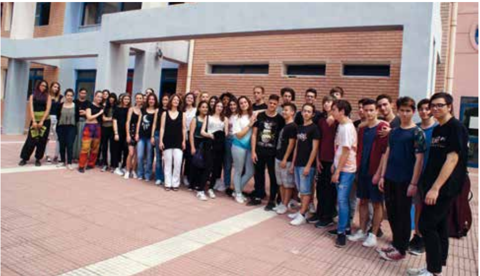
MIXED YOUTH CHOIR OF MUSIC SCHOOL OF ILION Ilion, Ελλάδα / Greece