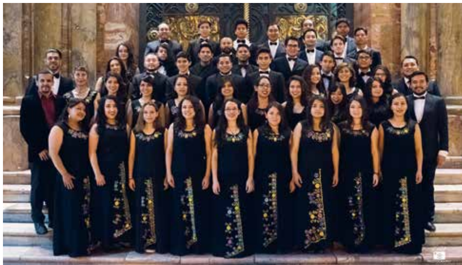
CORO JUVENIL DEL CONSERVATORIO SUPERIOR JOSÉ MARÍA RODRÍGUEZ Cuenca, Ισημερινός / Ecuador