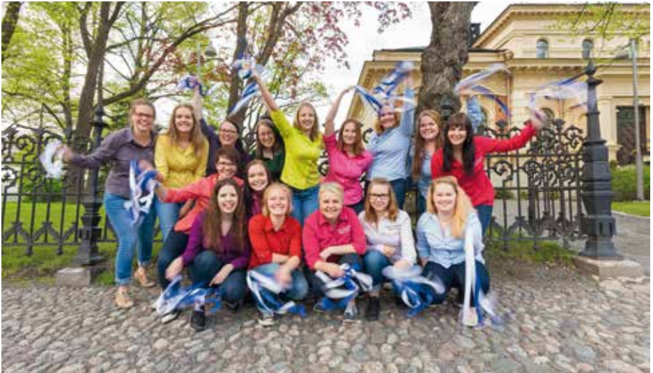
TURUN TUOMIOKIRKON NUORISOKUORO Turku, Φινλανδία / Finland