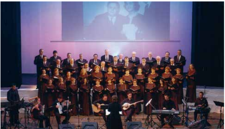
CULTURAL ASSOCIATION OF CHLOMOS (THOMAS PALAIOLOGOS) Corfu, Ελλάδα / Greece