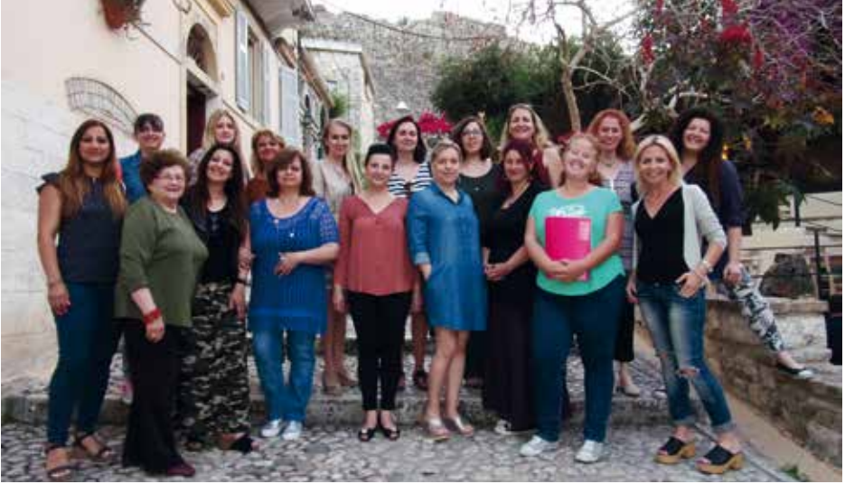
KORYFÓ Corfu, Ελλάδα / Greece