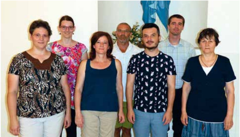
GLORIA DEI - HOMO VIVENS Bratislava, Σλοβακία / Slovakia