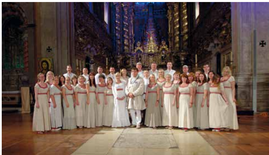
ITL SEGAKOOR Tallinn, Εσθονία / Estonia