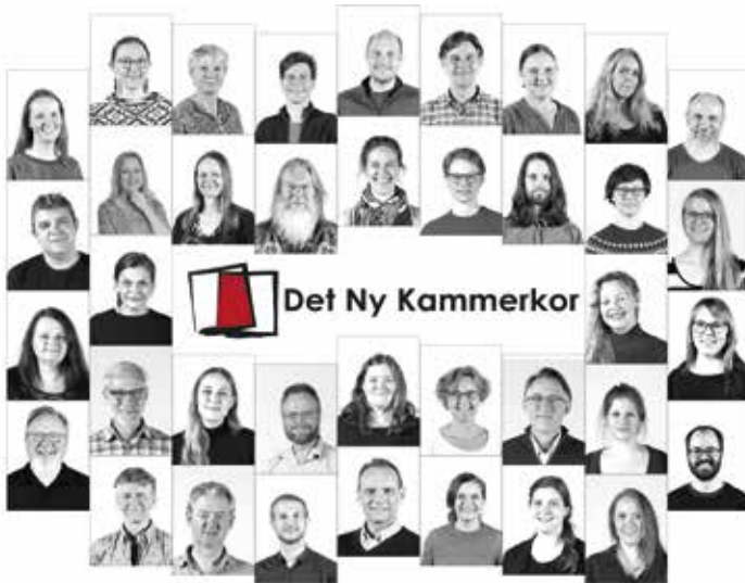
DET NY KAMMERKOR Aarhus, Δαβία / Denmark