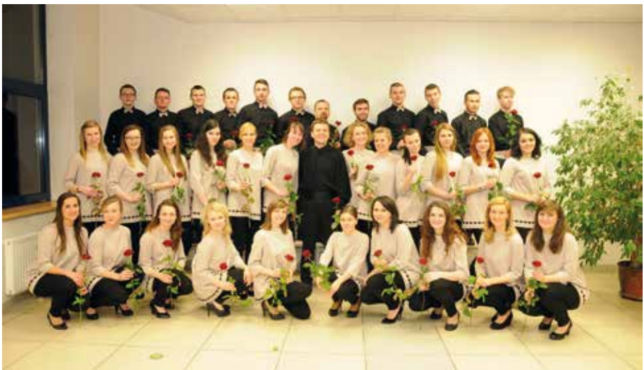
CHÓR UNIWERSYTETU PRZYRODNICZEGO WE WROCŁAWIU Wrocław, Πολωνία / Poland

Διευθύντρια / Conductor: Sølvi Myklebust