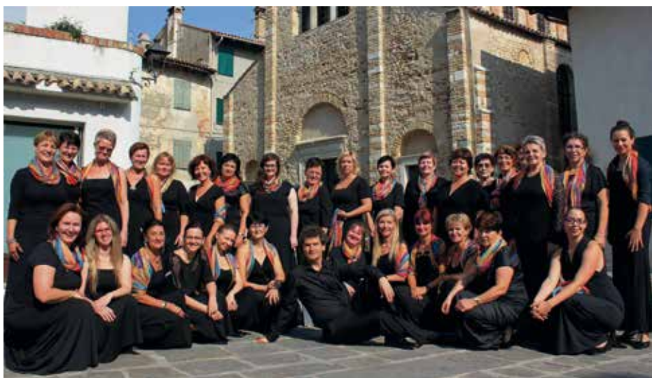
PĚVECKÉ SDRUŽENÍ OSTRAVSKÝCH UČITELEK Ostrava, Τσεχία / Czech Republic