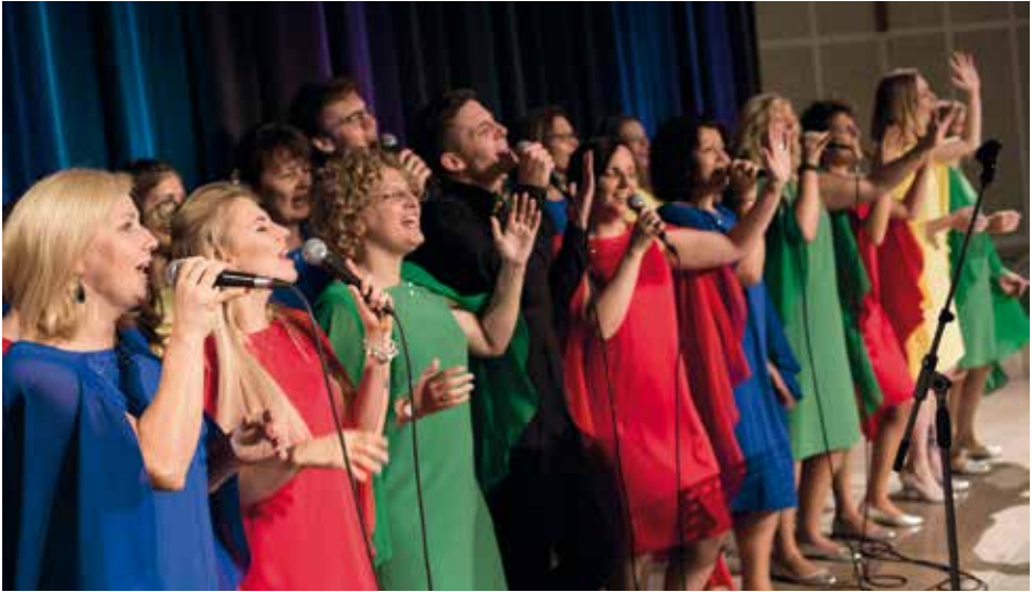
SIENNA GOSPEL CHOIR Warsaw, Πολωνία / Poland