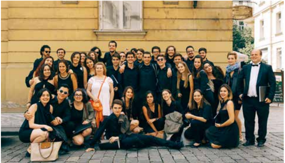
CORO ORGANUM Madrid, Ισπανία / Spain