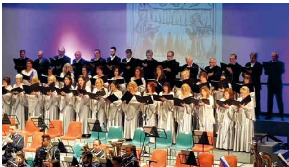
CORFU MUNICIPAL CHOIR "DIMODOKOS" Corfu, Ελλάδα / Greece