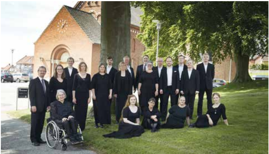
SCT PEDERS KONCERTKOR Randers, Δαβία / Denmark