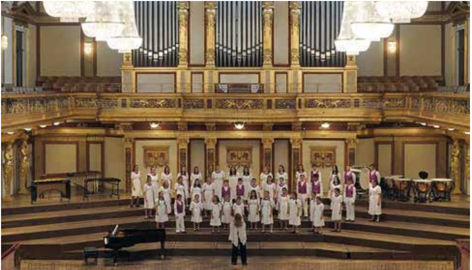
PAIDIKI CHORODIA KERKYRAS Corfu, Ελλάδα / Greece