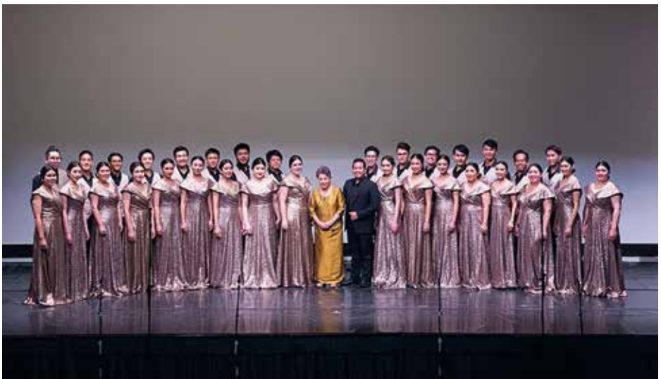
SUANPLU CHORUS Bangkok, Ταϊλάνδη / Thailand