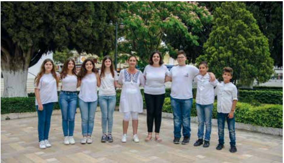
PAIDIKI XORODIA PETALOUDON RODOS Kremasti Rhodes, Ελλάδα / Greece