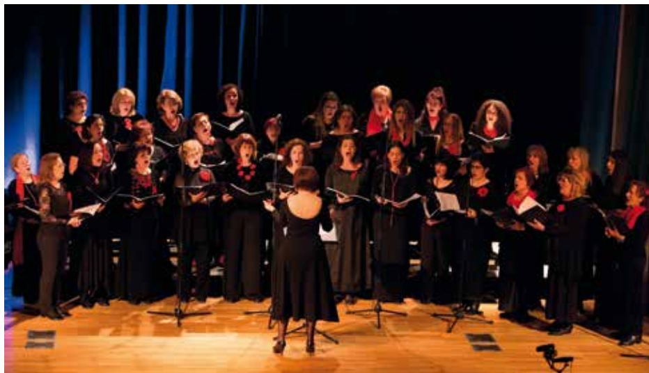
CANTUS ARTE Thessaloniki, Ελλάδα / Greece