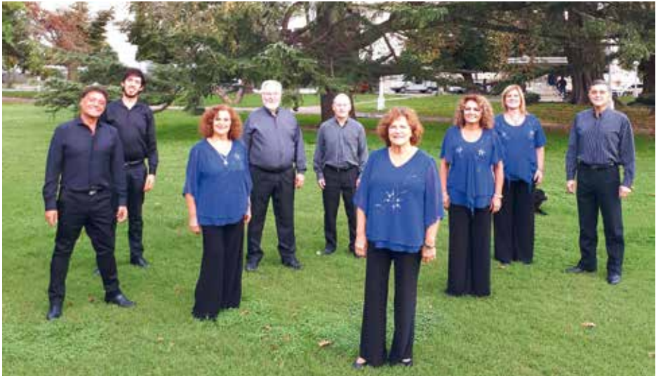
GRUPO VOCAL ARSIS NOVA Mar del Plata, Αργεντινή / Argentina