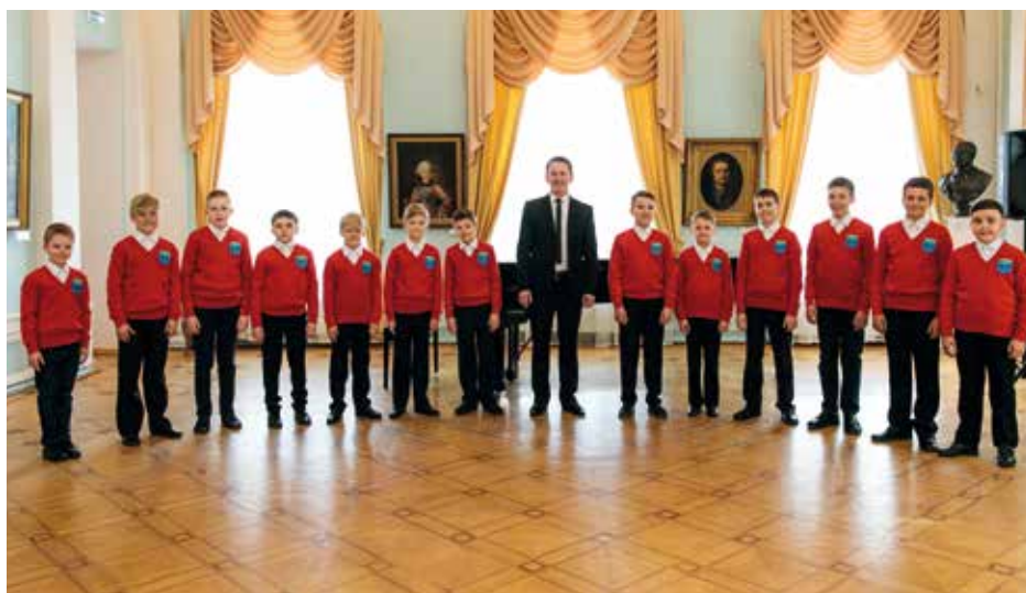
BOYS CHOIR OF THE MALE CHOIR SINGING CENTER Petrozavodsk, Krievija / Russia