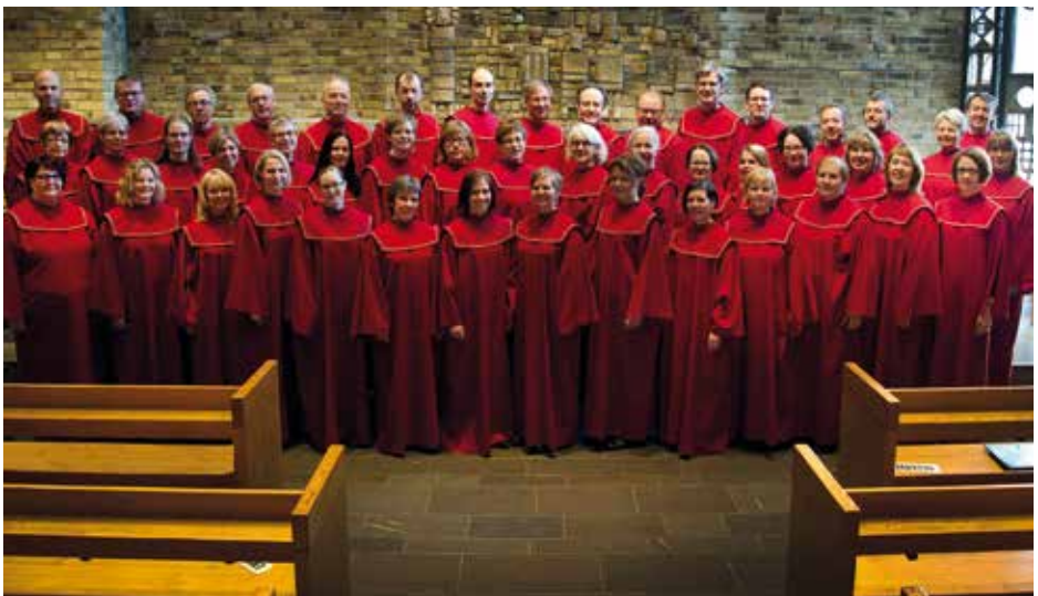
JOHANNELUNDS MOTETTKÖR Linköping, Zviedrija / Sweden