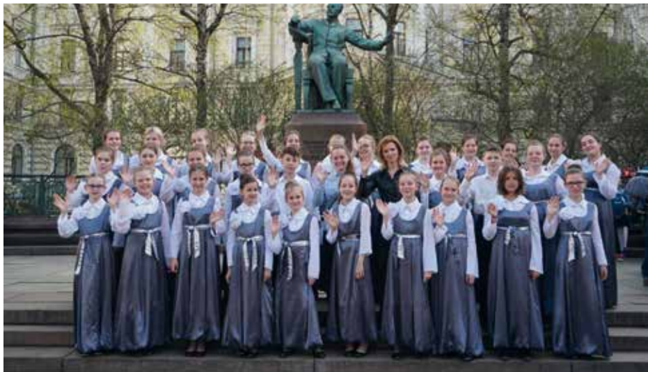
OBRAZTSOVY CHOIR KANTILENA OF THE MUSIC SCHOOL NR. 5 MINSK Minsk, Baltkrievija / Belarus