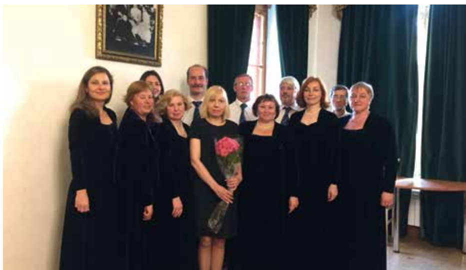
VOCAL AND CHORAL ENSEMBLE "ZVONNITSA" St. Petersburg, Krievija / Russia