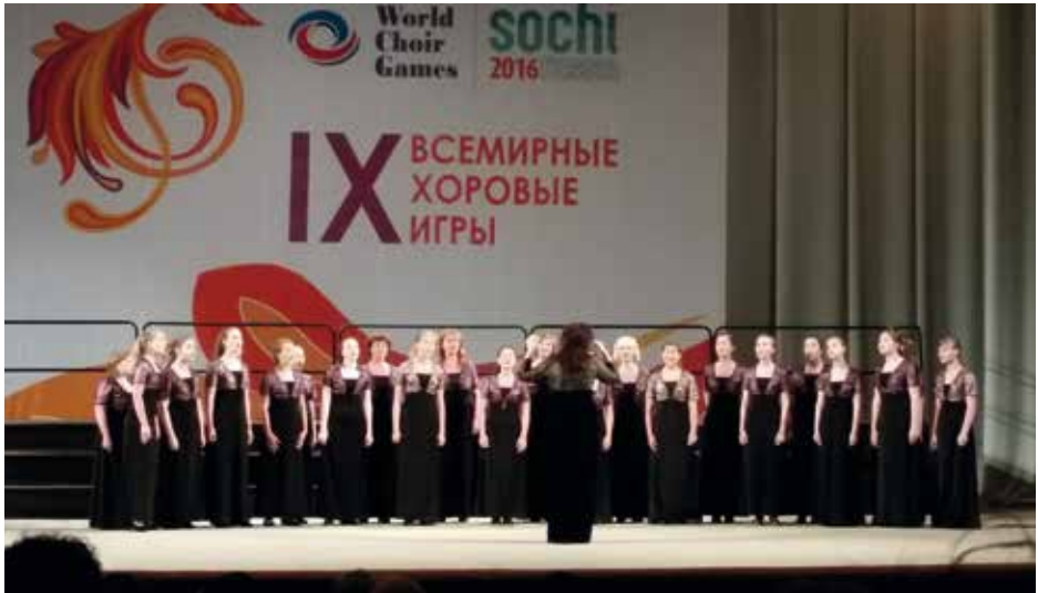
CHAMBER CHOIR "BALTIKA" Sosnovy Bor, Krievija / Russia