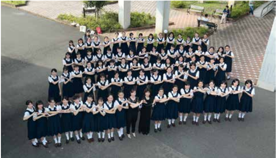
SEISEN HIGH SCHOOL CHOIR Kamakura City, Japāna / Japan