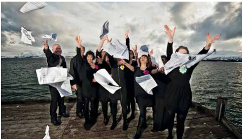
ARCTIC VOICES Tromsø, Norvēģija / Norway