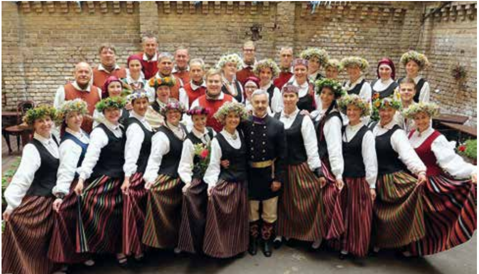
MIXED CHOIR BURTNIIEKS Rīga, Latvija / Latvia