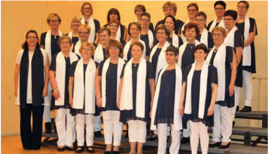
NORAKÖREN Närpes, Somija / Finland