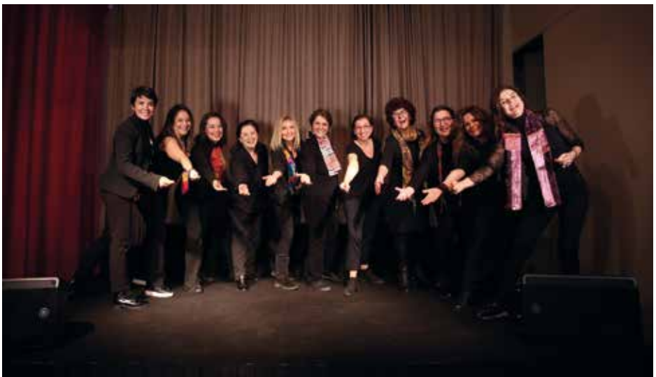
CEP SAHNE GÜVERCİN Istanbul, Turcija / Turkey