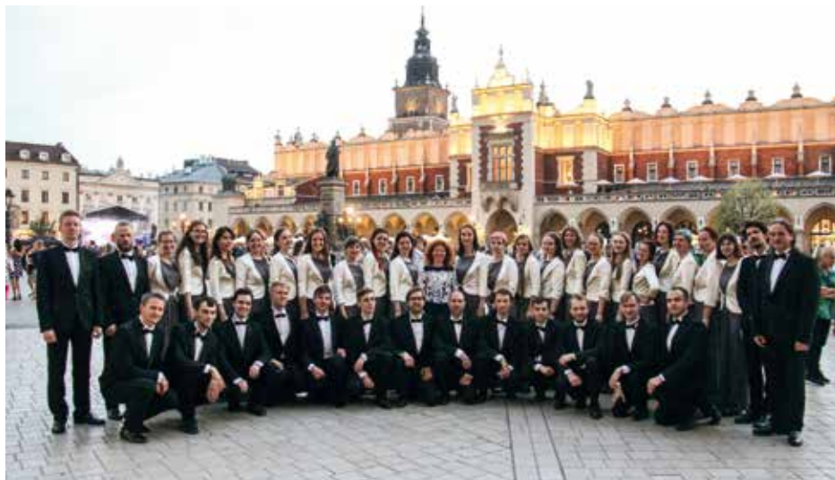
AK. KHOR SANKT-PETERBURGSKOGO G. E. UNIVERSITETA "LETI" St. Petersburg, Krievija / Russia