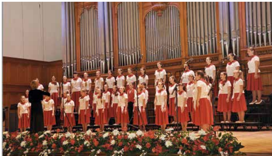
KHOROVAYA STUDIYA PIONERIA Zheleznodorozhny, Krievija / Russia