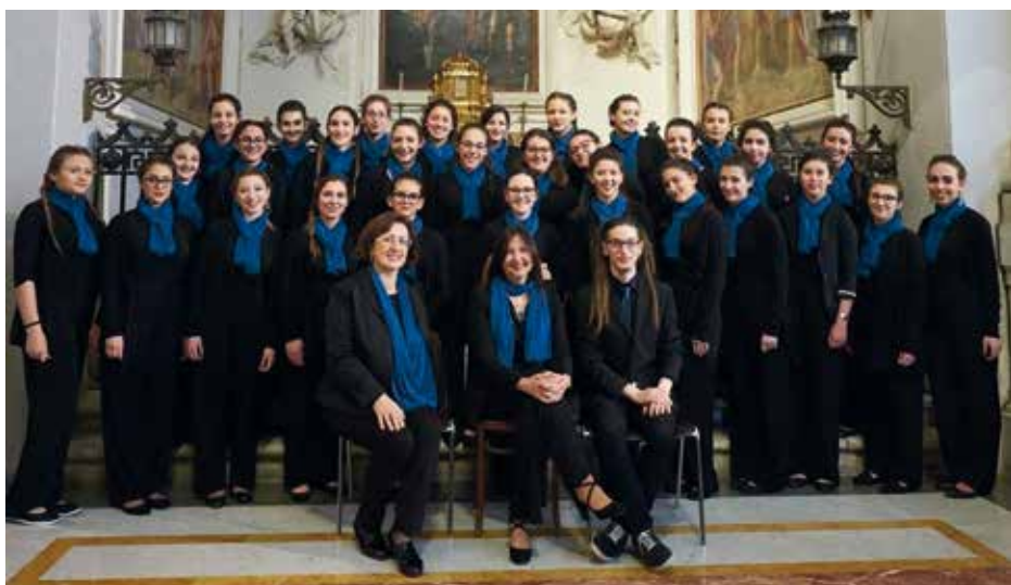
AEOLIAN VOCAL ENSEMBLE Palermo, Itālija / Italy