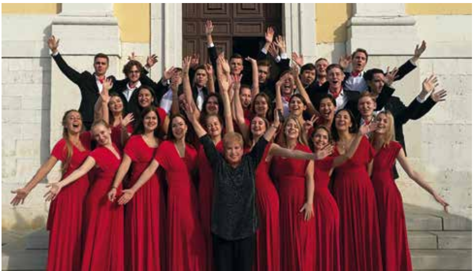
AK. KHOR MUZIKALNOGO UCHILISCHA RAM IMENI GNESINIKH Moscow, Krievija / Russia