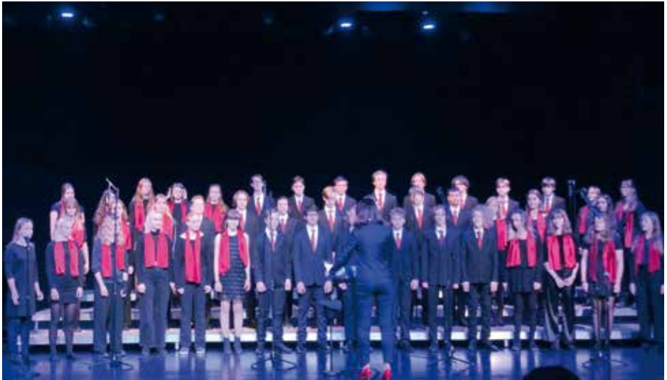
ADOLF FREDRIKS MUSIKKLASSER 9CD Stockholm, Zviedrija / Sweden