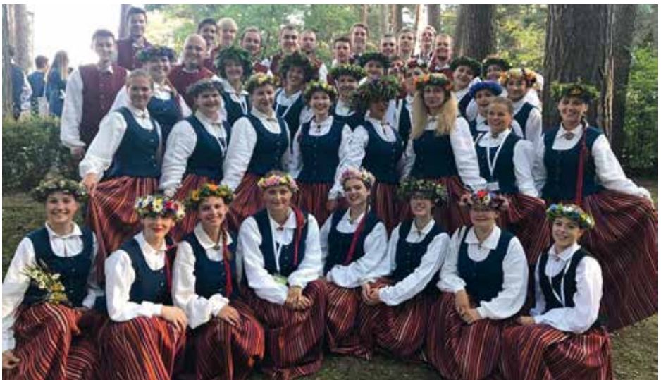
OGRE CULTURAL CENTRE YOUTH CHOIR "IMPULSS" Ogre, Latvija / Latvia