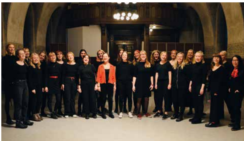
LARSSONS FRISERSALONG Lund, Zviedrija / Sweden